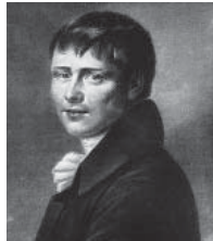
Heinrich von Kleist

Öffnungszeiten: Fr 14-18 Uhr Sa, So 12-17 Uhr / Eintritt: 2,- €